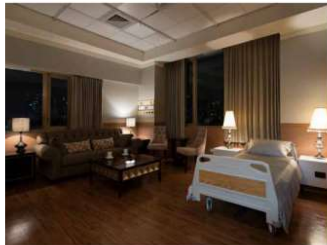
高級健檢尊爵套房