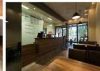
天成水岸人文空間